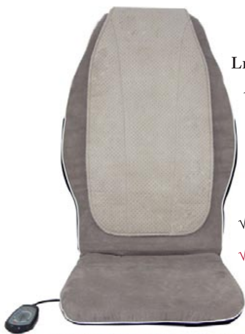
Avec la « protection confort » rabattable