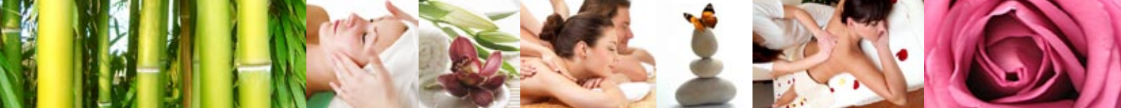
Table de massage pliante « Confort »